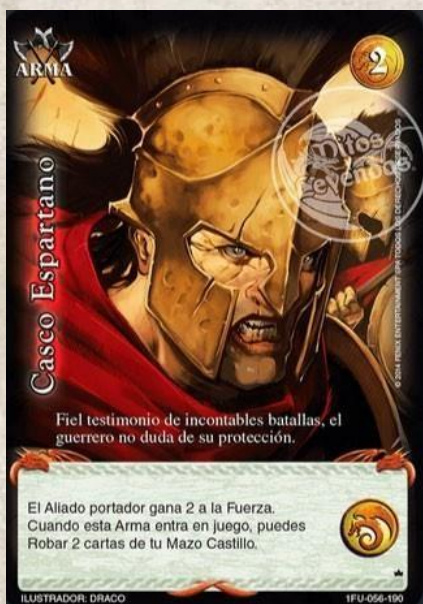
Casco Espartano Arma C:2

“El Aliado portador gana 2 a la Fuerza. Cuando esta Arma entra en juego, puedes Robar 2 cartas de tu Mazo Castillo”.